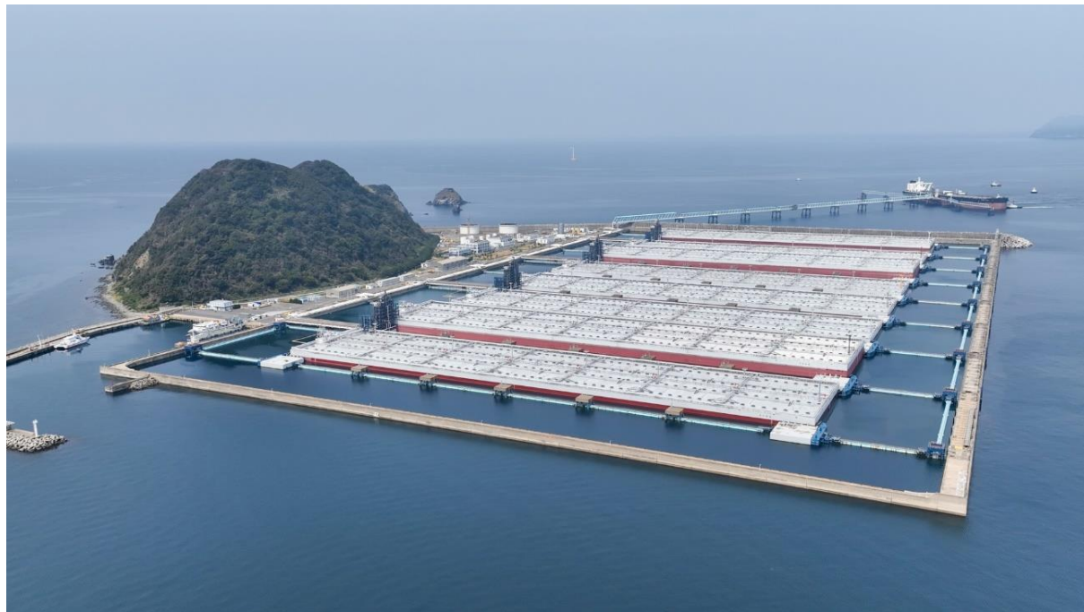
白島国家石油備蓄基地