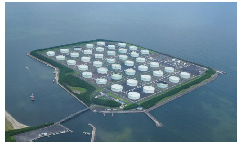
志布志国家石油備蓄基地