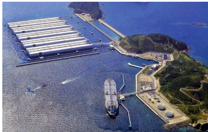
上五島国家石油備蓄基地