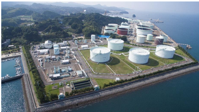
菊間国家石油備蓄基地