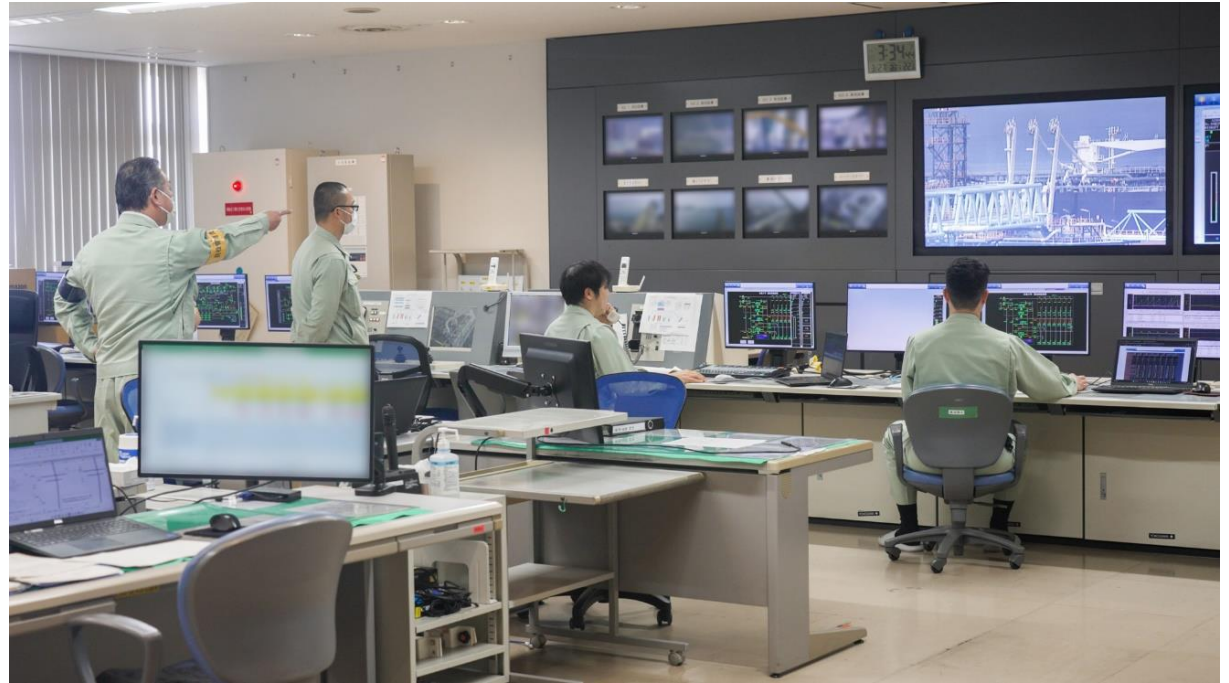
白島国家石油備蓄基地 中央監視制御室 放出開始の様子