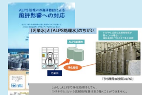
(広報パンフレット)