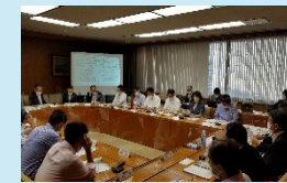
(流通事業者向け説明会)